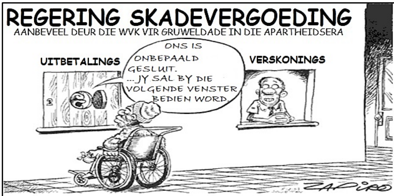
[Vertaal uit https://www.iol.co.za/news/politics/apartheid-victims-angry-about-reparation-wait- Toegang op 22 Januarie 2023 verkry.]

*Zapiro – 'n Welbekende Suid-Afrikaanse spotprenttekenaar