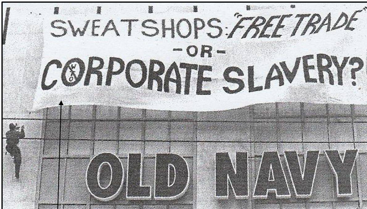
[Uit New Generation History deur S. Govender et al]

Hierdie plakkaat val groot korporasies (besighede) in 1998 in Washington D.C. aan.