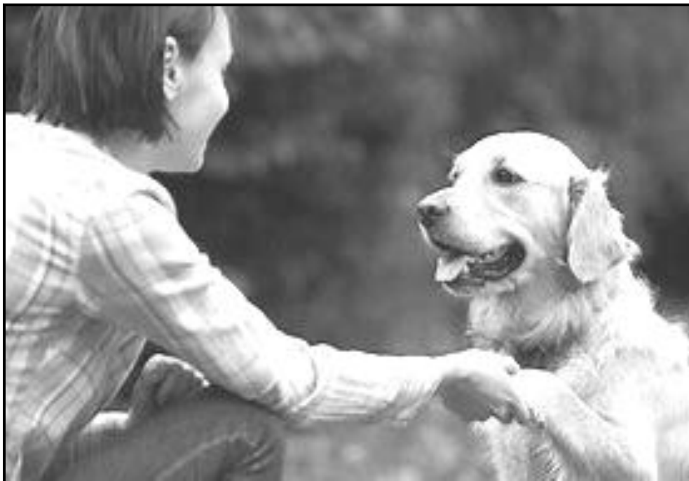
[Tshi bva kha www.black and white images ]